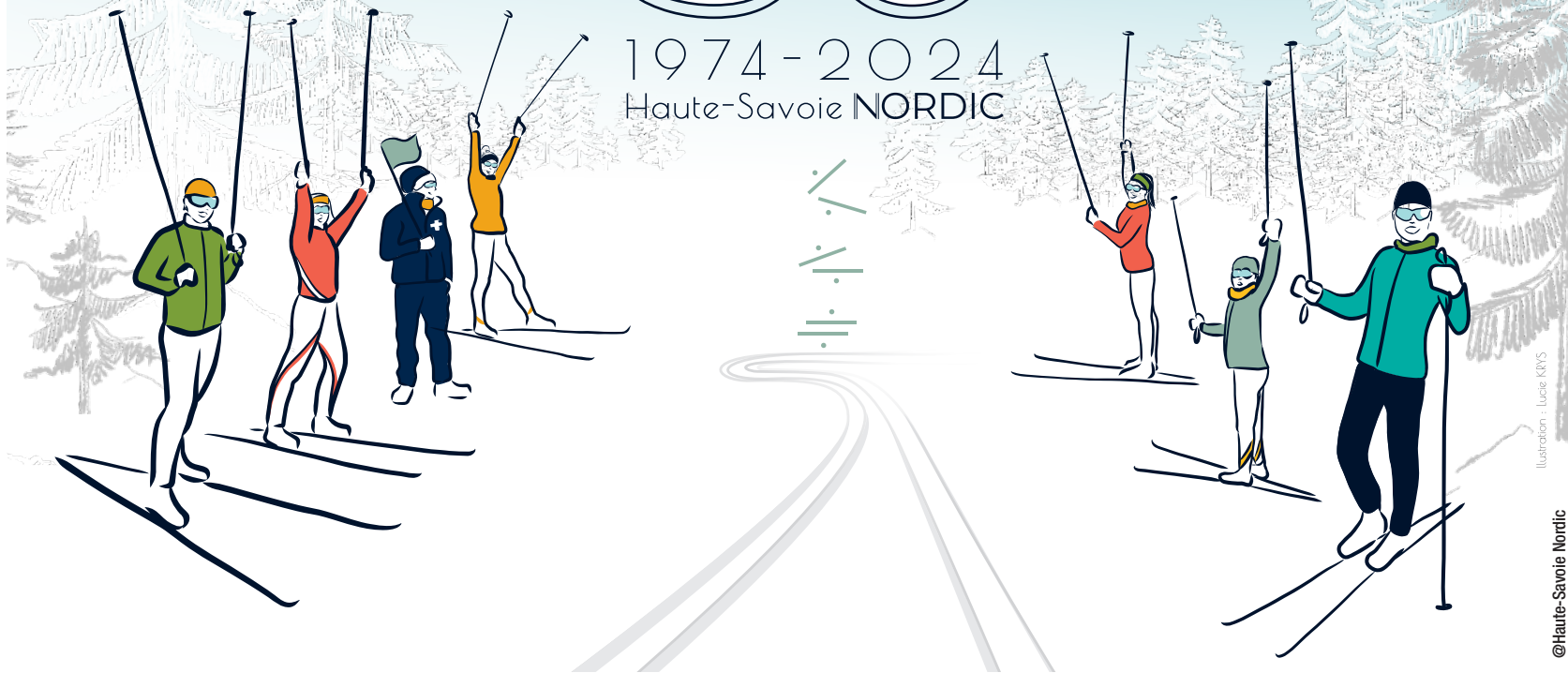
Illustration : Lucie KIRYS